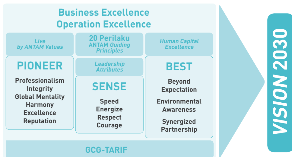
Untuk Mewujudkan Visi 2030, Seluruh Insan ANTAM Memiliki Komitmen untuk Menerapkan Nilai-Nilai Perusahaan dalam Setiap Aktivitas Operasional ANTAM Employees are Committed in Implementation of Corporate Values in Every Operational Aspect to Pursue Company's Vision 2030

The following is a chart of the implementation of ANTAM's Values to Realize ANTAM's Vision 2030