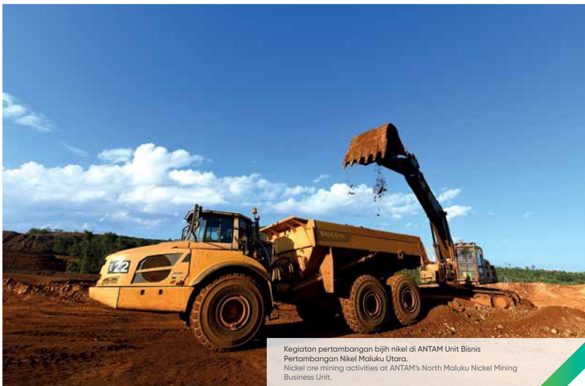
Kegiatan pertambangan bijih nikel di ANTAM Unit Bisnis Pertambangan Nikel Maluku Utara. Nickel ore mining activities at ANTAM's North Maluku Nickel Mining Business Unit.

Provide Sustainable Economic Contribution