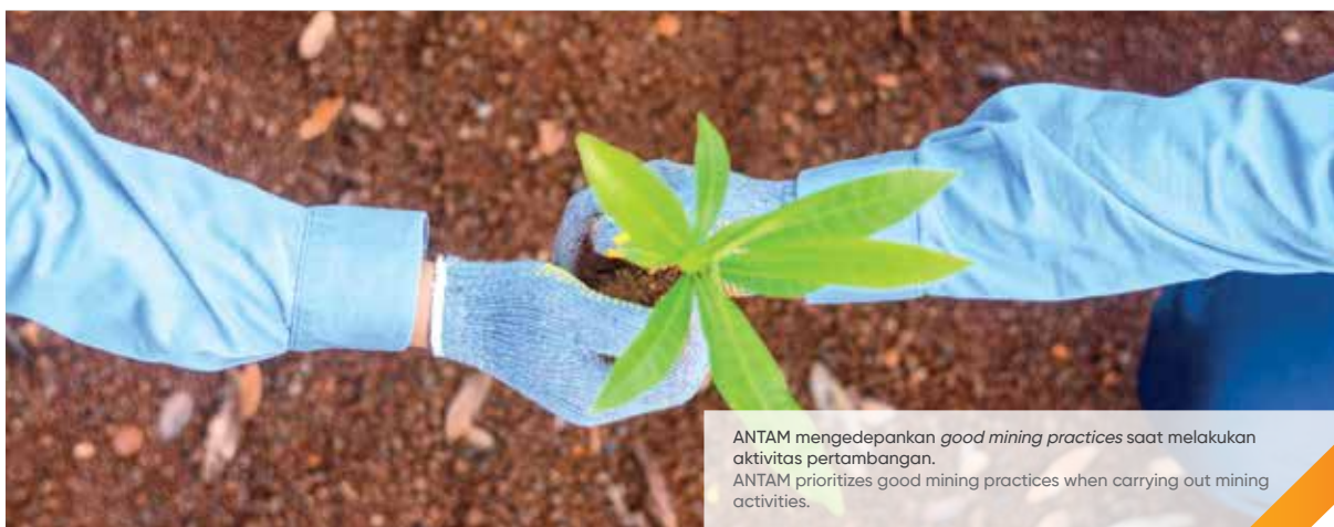
ANTAM mengedepankan good mining practices saat melakukan aktivitas pertambangan. ANTAM prioritizes good mining practices when carrying out mining activities.