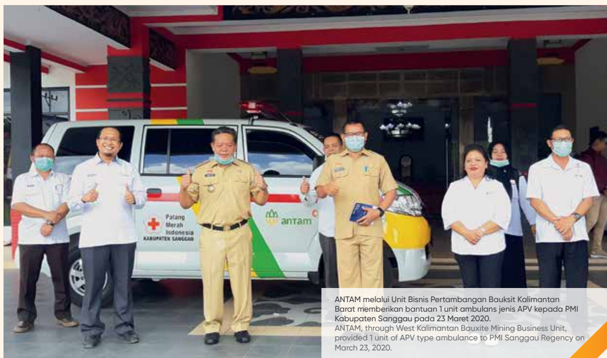
ANTAM melalui Unit Bisnis Pertambangan Bauksit Kalimantan Barat memberikan bantuan 1 unit ambulans jenis APV kepada PMI Kabupaten Sanggau pada 23 Maret 2020. ANTAM, through West Kalimantan Bauxite Mining Business Unit, provided 1 unit of APV type ambulance to PMI Sanggau Regency on March 23, 2020.

With the new ambulance unit, PMI Sanggau Regency can now reach 15 Districts, 162 Hamlets, and 6 Villages with a total area of 12,000 km 2 with a population distribution of ±450,000 people and the availability of blood as much as 450 bags every month. Through this program, it is hoped that the availability of blood stocks in Bloodbank UDD PMI Sanggau Regency will increase to facilitate the needy people in the Sanggau Regency area.