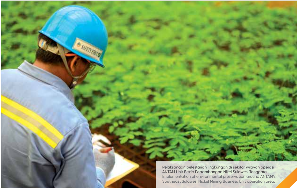
Pelaksanaan pelestarian lingkungan di sekitar wilayah operasi ANTAM Unit Bisnis Pertambangan Nikel Sulawesi Tenggara. Implementation of environmental preservation around ANTAM's Southeast Sulawesi Nickel Mining Business Unit operation area.

ANTAM berkomitmen untuk mendukung agenda pembangunan global dengan tetap memperhatikan prinsip-prinsip keberlanjutan di setiap kegiatan operasinya. Komitmen ini diimplementasikan dalam dokumen Masterplan CSR yang menjadi panduan dalam melaksanakan kegiatan pengembangan masyarakat yang diperbarui setiap lima tahun.