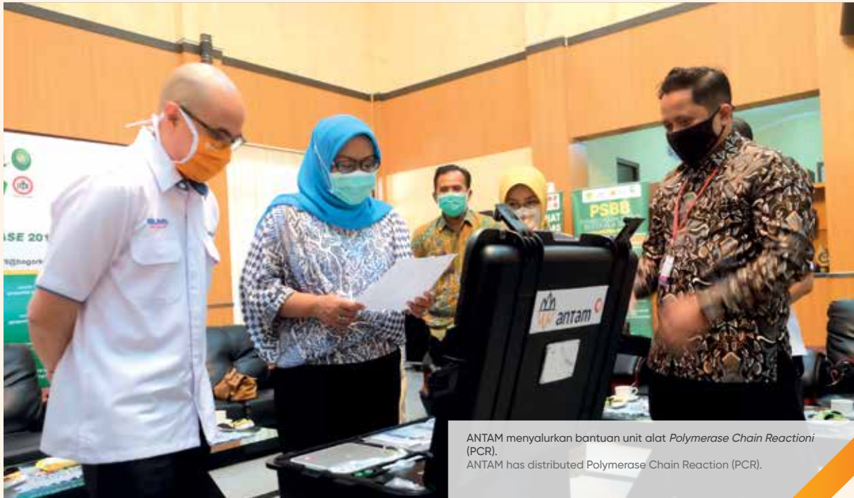
ANTAM menyalurkan bantuan unit alat Polymerase Chain Reaction (PCR). ANTAM has distributed Polymerase Chain Reaction (PCR).

Southeast Sulawesi Nickel Mining Business Unit synergized with the Local Government had distributed 7,528 basic food packages to the surrounding community that impacted by the pandemic. ANTAM also provided sports equipments such as, table tennis and badminton equipment for the community in maintaining fitness. Meanwhile, the North Maluku Nickel Mining Business Unit were built quarantine places in Maba, Buli, East Halmahera for COVID-19 patients isolation room, and distribution of 2,700 food packages. Meanwhile, through head office and Precious Metals Processing and Refinery Business Unit, We distributed 7,800 and 746 food packages.