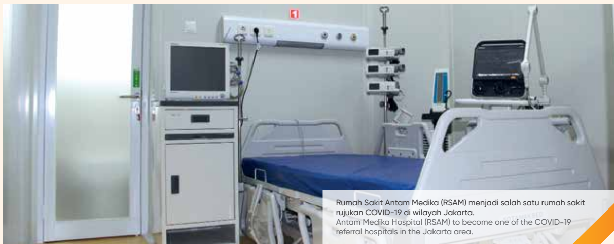
Rumah Sakit Antam Medika (RSAM) menjadi salah satu rumah sakit rujukan COVID-19 di wilayah Jakarta. Antam Medika Hospital (RSAM) to become one of the COVID-19 referral hospitals in the Jakarta area.

Besides, ANTAM is also conducting laboratory renovations to improve COVID-19 service facilities at the North Maluku Regional General Hospital (RSUD) and ANTAM's Pomalaa Hospital (RSAP). ANTAM's commitment to handling COVID-19 was also demonstrated by providing Polymerase Chain Reaction (PCR) facilities at Maba Hospital, Leuwiliang Hospital, Antam Pomalaa Hospital and in the area of Raja Ampat District, West Papua through PT Gag Nikel.