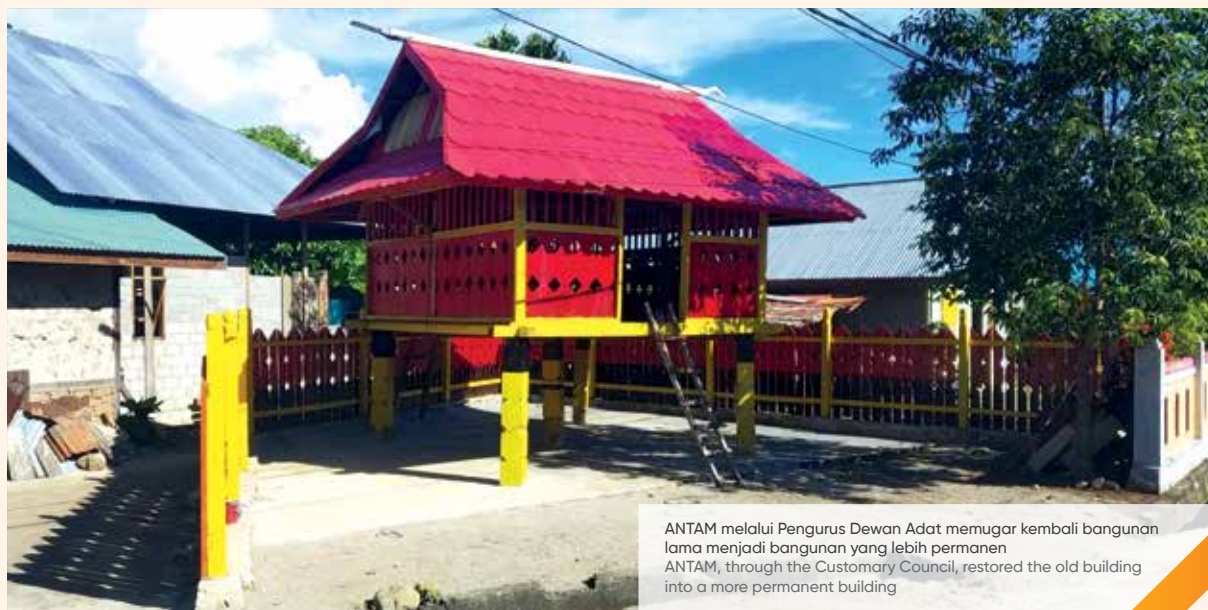
ANTAM melalui Pengurus Dewan Adat memugar kembali bangunan lama menjadi bangunan yang lebih permanen ANTAM, through the Customary Council, restored the old building into a more permanent building

With the new building that has been completed, ANTAM hopes to inspire the younger generation to maintain, advance, and preserve the culture of the people of Buli Village, which has started to erode. So that the sense of nationalism, the spirit of wanting to advance, defend the right, and have a noble and dignified character, can be owned by the next generation of Iyan Toa.