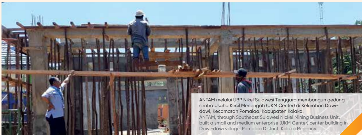
ANTAM melalui UBP Nikel Sulawesi Tenggara membangun gedung sentra Usaha Kecil Menengah (UKM Center) di Kelurahan Dawi-dawi, Kecamatan Pomalaa, Kabupaten Kolaka. ANTAM, through Southeast Sulawesi Nickel Mining Business Unit, built a small and medium enterprise (UKM Center) center building in Dawi-dawi village, Pomalaa District, Kolaka Regency.

The background of the construction of ANTAM's UKM Center building is the many ANTAM's Foster Partners products that have good selling value but do not have good promotional and marketing facilities. Furthermore, ANTAM through the UKM Center also runs a product quality and packaging certification program to improve product quality and competitiveness of Foster Partners' SMEs. This is also a form of ANTAM's commitment and support for the Foster Partners' economic development to realize the community's financial independence.