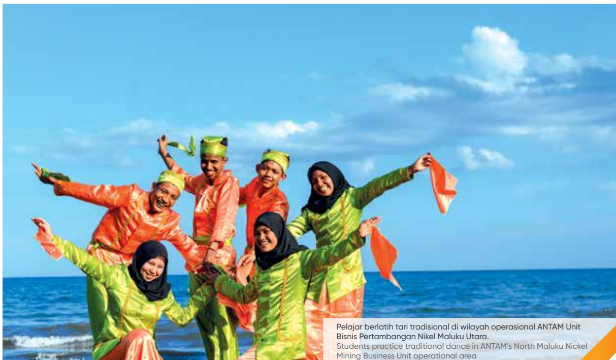
Pelajar berlatih tari tradisional di wilayah operasional ANTAM Unit Bisnis Pertambangan Nikel Maluku Utara. Students practice traditional dance in ANTAM's North Maluku Nickel Mining Business Unit operational area

Until now, the analysis of swab test samples from the East Halmahera Regency still has to be sent to Ternate, so it requires a process of time, effort, and cost. With this program, it is hoped that it can accelerate handling patients infected with COVID-19 and stop the spread of COVID-19 in East Halmahera.