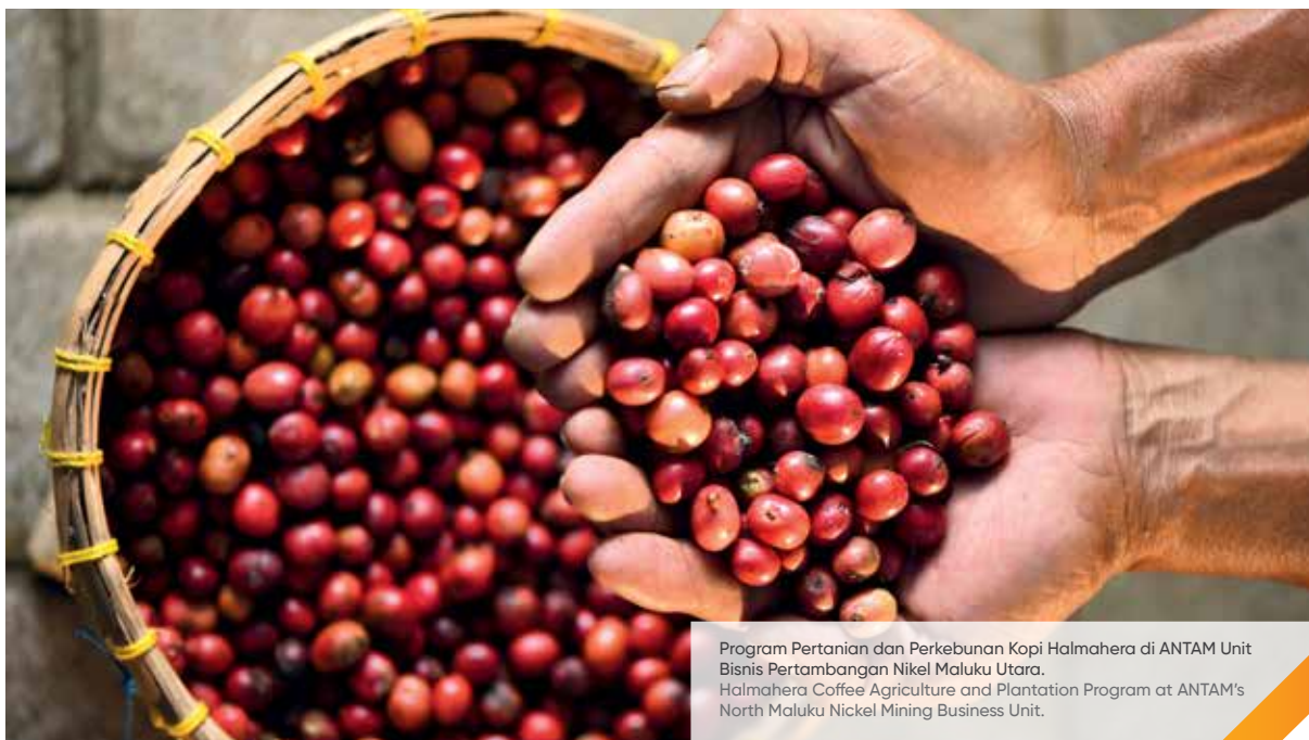
Program Pertanian dan Perkebunan Kopi Halmahera di ANTAM Unit Bisnis Pertambangan Nikel Maluku Utara. Halmahera Coffee Agriculture and Plantation Program at ANTAM's North Maluku Nickel Mining Business Unit.